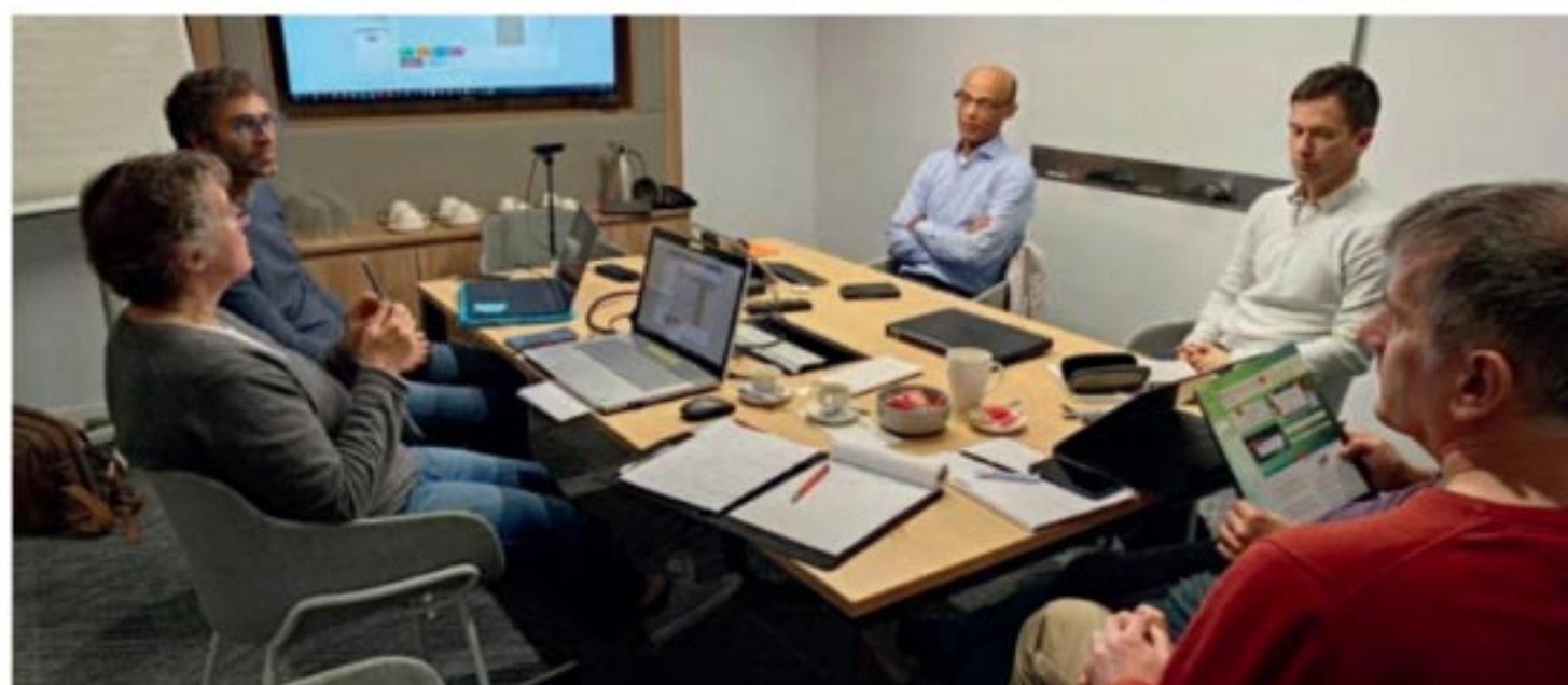
ETHIC TAM TAM (Cuadro de mando colaborativo para pedidos).